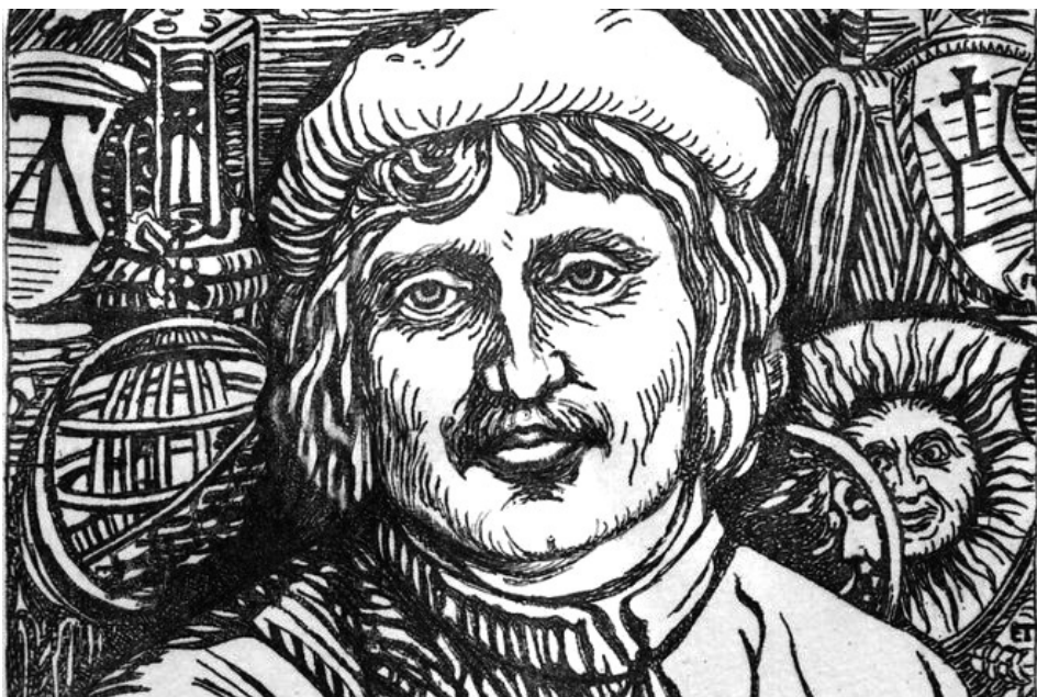
Franciszek Skaryna (przed 1490, Polock – po 1540, Praga)