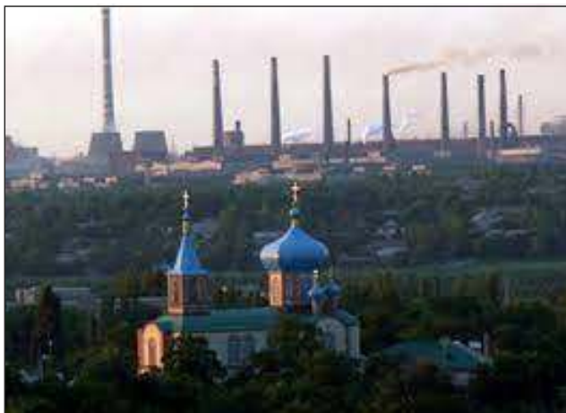
Маріуполь, панорама міста перед російською агресією 24 лютого 2022 р.

Матеріали конференції будуть опубліковані 2023 р. у Науковій видавничій серії «Colloquia Orientalia Bialostocensia», яку видає Кафедра філологічних досліджень «Схід – Захід». Статті також можуть бути опубліковані у періодичних виданнях Університету в Білостоці („Bibliotekarz Podlaski”, „Linuodidactica”, „Studia Wschodniostowiańskie”, які є фаховими науковими часописами Міністерства освіти і науки РП)