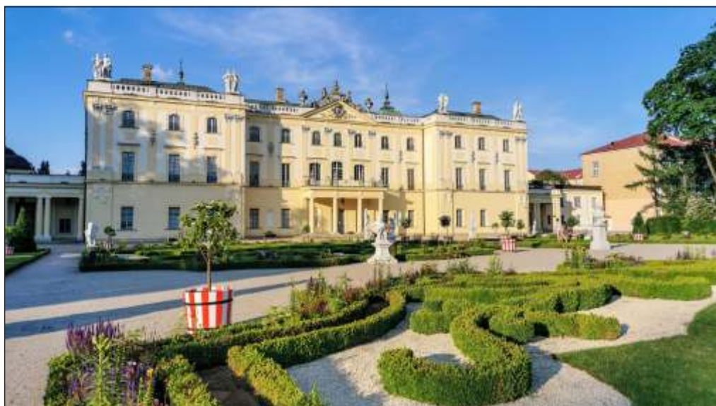
Білосток, Палац Браницьких, вигляд з боку саду, ХХІ століття