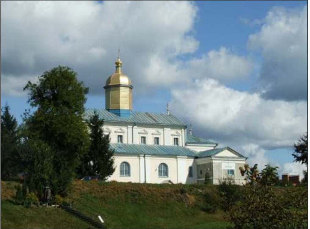
Wołyń, cerkiew, XXI wiek