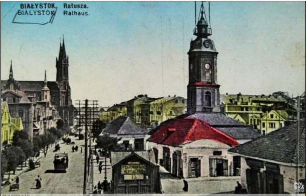
Білосток, Ратуша, листівка, початок XX століття