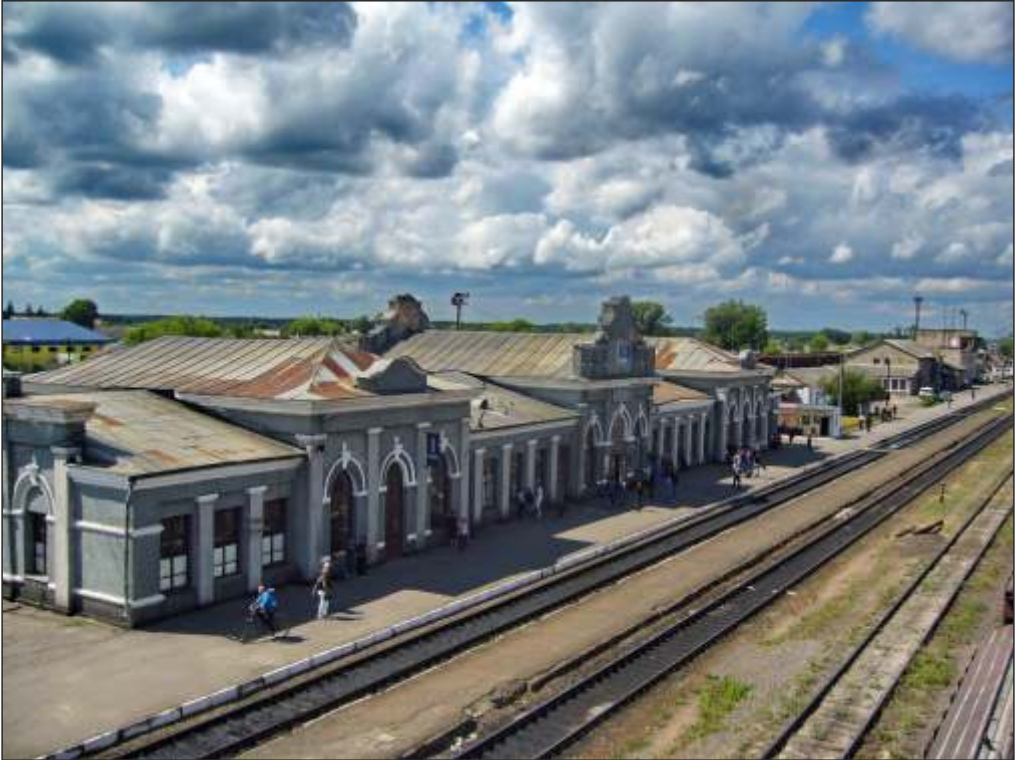
Залізничний вокзал у Сарнах, Україна, XXI століття