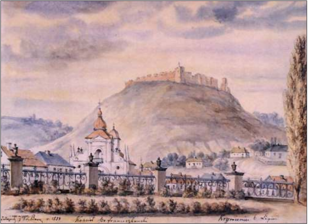
Наполеон Орда, Кременець, між 1862 і 1876 рр.