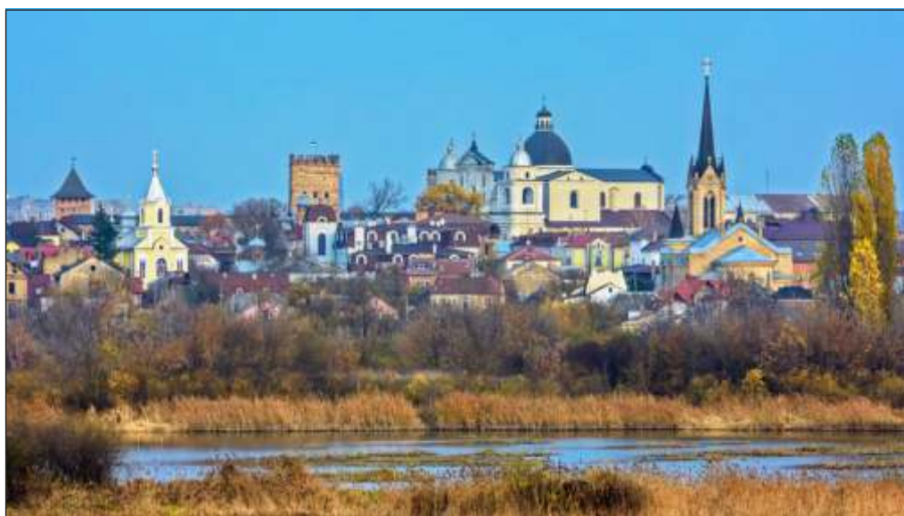
Луцьк на Волині, сучасна панорама, XXI століття