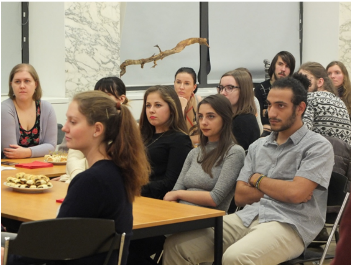
Studenci Uniwersytetu Komeńskiego podczas corocznego spotkania bożonarodzeniowego w Instytucie Polskim w Bratysławie