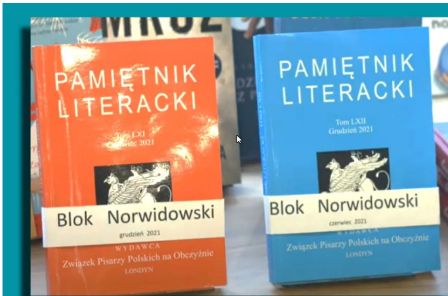
Bloki Norwidowskie w dwu „Pamiętnikach Literackich” pod red. R. Wasiak-Taylor, Londyn 2021. Czasopismo jest wydawane w Londynie przez Związek Pisarzy Polskich na Obczyźnie od 1976 roku