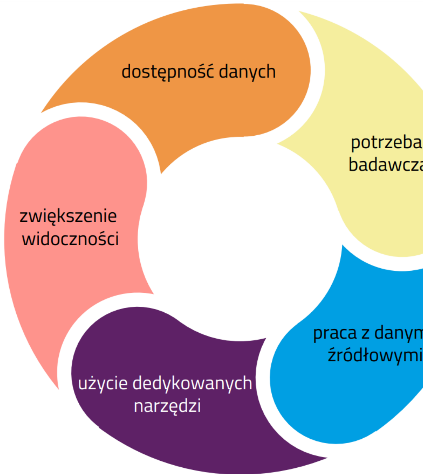
Rys. 2. Cykl komunikacyjny

W naszej współpracy punktem wyjścia były literaturoznawcze teksty naukowe opublikowane w otwartym dostępie. Długotrwała praca przy zasobach bibliograficznych doprowadziła nas do zdefiniowania potrzeby automatycznego uzupełniania metadanych dla tekstów ze względu na dołączane do artykułów materiały, takie jak notki biograficzne, słowa kluczowe czy abstrakty. Podczas pracy