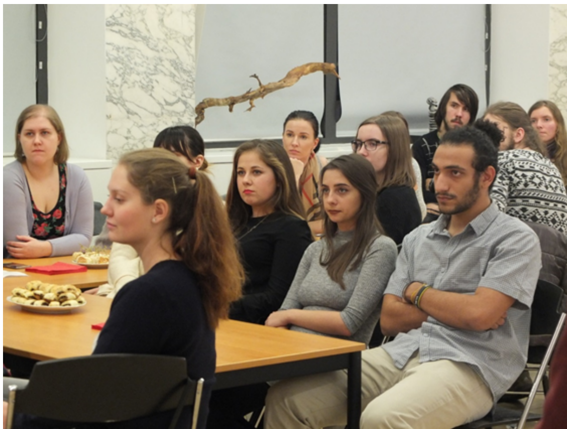
Studenci Uniwersytetu Komeńskiego podczas corocznego spotkania bożonarodzeniowego w Instytucie Polskim w Bratysławie