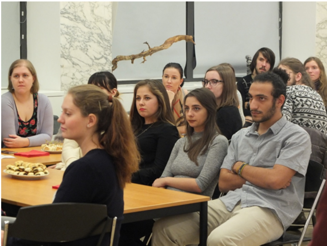
Studenci Uniwersytetu Komeńskiego podczas corocznego spotkania bożonarodzeniowego w Instytucie Polskim w Bratysławie