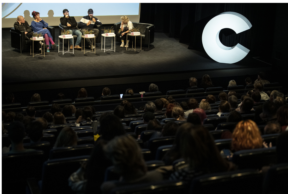
Festiwal Conrada 2022