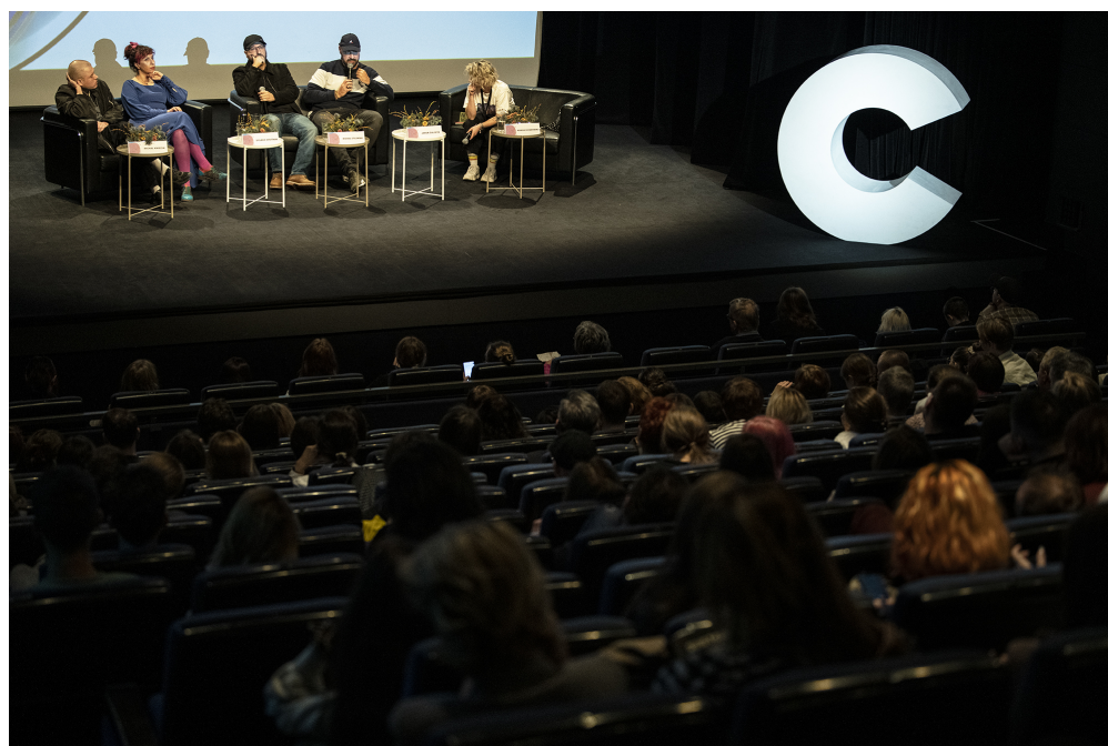
Festiwal Conrada 2022