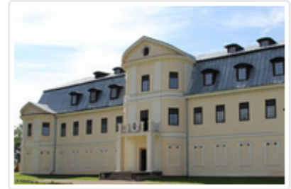
Kraslaw - Pałac